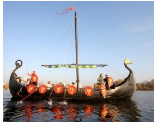
Б) Руська лодія.

2. Оцініть наслідки Столітньої війни для подальшого розвитку Франції. Чому саме Франція здобула перемогу? ( 6 балів)